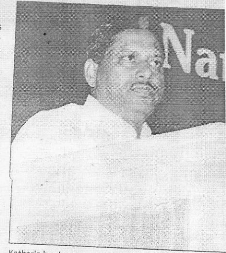
Katheria has been served NBWs in two cases. He was booked by Sadar Police for staging protest demanding a bench of Allahabad high court.